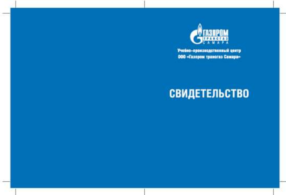
Размер 184×120 мм