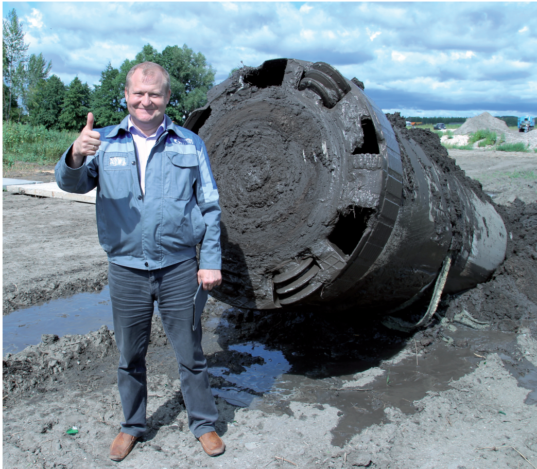
Всегда вот с таким отношением к делу и к людям!

В это время в Сызрани начал строиться завод медоборудования, предполагалось, что он станет крупнейшим в Европе. Работникам, попавшим в числе первых в дирекцию строительства, давали жилье, зарплата была достаточно высокой. «По благу» предложили устроиться мастером в котельную. Но сделать этот важный шаг никак не получалось, потому что день за днем находилось что-то более важное, чем визит в отдел кадров завода: то срабатывание защиты на ГРС, то срочные ППР. В итоге «блатное» место «ждать не стало». А