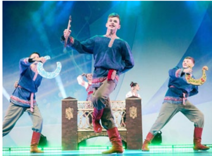
Вот оно, это выступление! И на заднем плане – мост.

Кроме Димы во дворец спорта еще нужно было срочно доставить реквизит – сборную конструкцию бутафорского моста. Успели по минутам к началу репетиции, вот только крепления для реквизита остались в отеле. Отрепетировали без реквизита, вернулись в отель, взяли крепления и снова поехали во дворец, чтобы собрать конструкцию на вечернее выступление. Как результат, у них первое место в их номинации! А у меня на 100 седых волос больше.