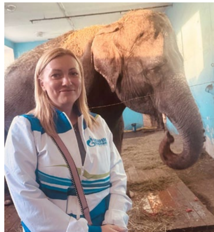
Самара – родина слонов, правда ведь?