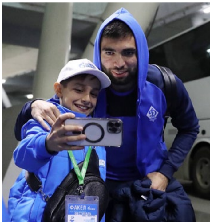
Встреча земляков в Самаре

– Бывают в жизни удивительные совпадения. В один из «факельных» дней, а именно 2 октября, на стадионе «Солидарность Самара Арена» должен был состояться матч между «Крыльями Советов» и «Динамо Махачкала». Мы с делегацией собирались на него идти – махачкалинские гости не могли пропустить возможность поболеть за земляков. И вдруг в отеле я вижу, как руководители моей делегации общаются с людьми, одетыми в футболки с логотипом махачкалинского Динамо.