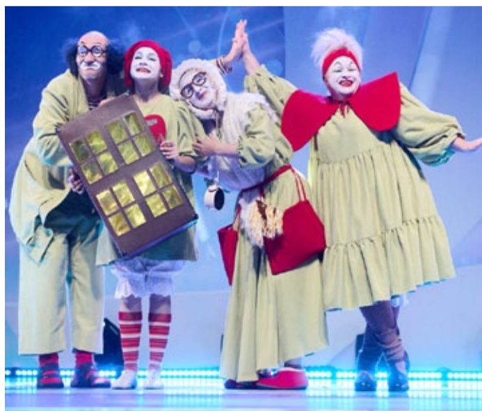
В руках у артистов тот самый чемодан

– В театральной постановке моих подопечных была задействована масса реквизита. Чтобы ничего не забыть и не потерять, все мелкие вещи держали в одном месте, а именно раскладывали на чемодане, который тоже был задействован. В один прекрасный момент кто-то толкнул детскую коляску (тоже реквизит), она, естественно, покатила, наехала на чемодан, все, что на нем лежало, разлетелось в разные стороны, хорошо, хоть за кулисами. Надо было восстанавливать первоначальный облик конструкции, причем так, чтобы из зала никто не заметил активных перемещений. Кроме меня рядом никого не было. Пришлось ползти по-пластунски и собирать реквизит. В итоге выступление, по словам представителей делегации, было очень удачным.